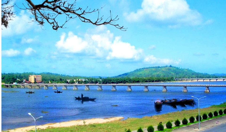
Núi Thiên Ân, nhìn từ thành phố Quảng Ngãi.

Quảng Ngãi là tỉnh duyên hải miền Trung Việt Nam có nhiều thắng cảnh đẹp. "Núi Ân, sông Trà": hai địa danh nổi tiếng là núi Thiên Ân và sông Trà Khúc. Đây là hai thắng cảnh có tính biểu tượng của tỉnh Quảng Ngãi và luôn đi đôi với nhau, tạo thành "cặp bài trùng" thú vị. Sự kết hợp tài tình của hai vẻ đẹp này đã cho ra đời một bức tranh sơn thủy hữu tình, có một không hai. Núi Ân cao, trên ngọn núi này, rừng xanh đẹp lắm, rừng cây khuyh điệp như Thiên Đàng hạ giới. Sông Trà tuyệt đẹp, nước trong vắt.