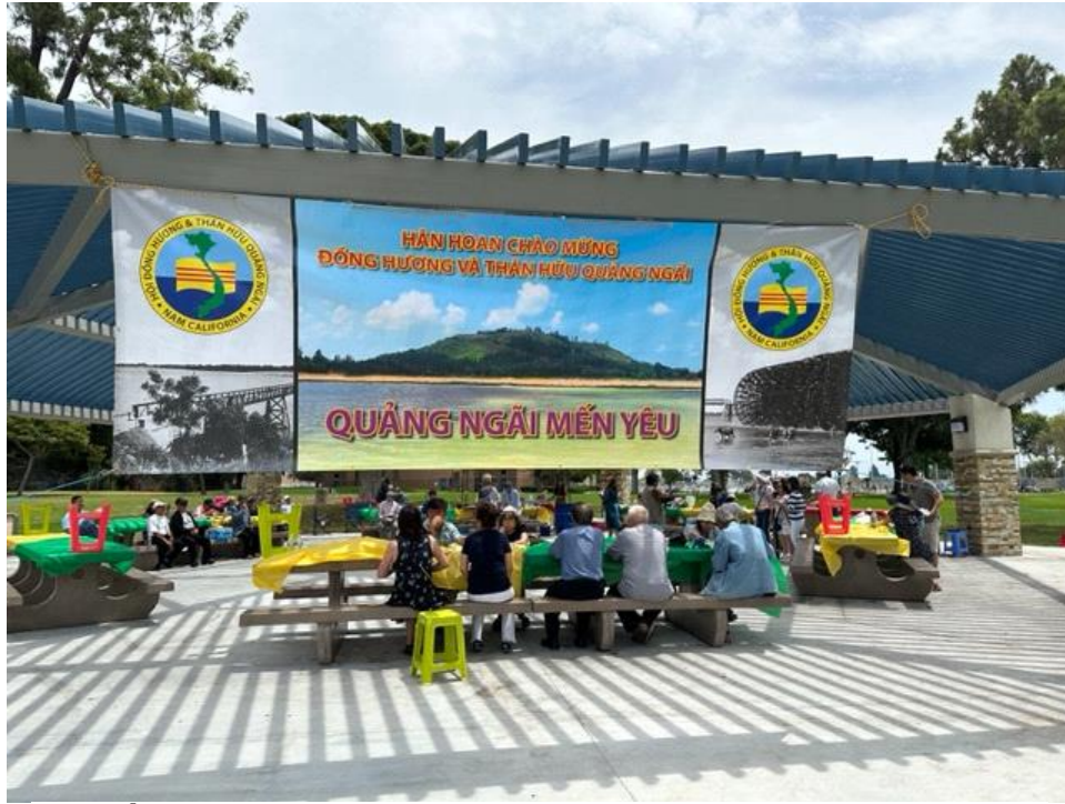
Hội Đồng Hương và Thân Hữu Quảng Ngãi họp mặt Hè 2023 Chủ Nhật, 23 tháng 7 năm 2023