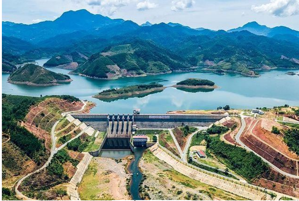
Núi Ân, sông Trà