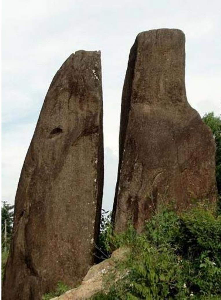
Núi Đá Chẻ

Đặc biệt là La Hà Thạch Trận: La Hà là tên của một quần thể 4 ngọn núi nằm trên địa bàn thị trấn La Hà, thuộc huyện Tư Nghĩa, gồm núi Cao Cỗ, núi Đá Chẻ, núi Voi và núi Hùm. La Hà được ông quan, thi sĩ Nguyễn Cư Trinh tặng cho mỹ tự La Hà thạch trận (Trận đá La Hà) và là một trong mười cảnh đẹp nổi tiếng của tỉnh Quảng Ngãi: