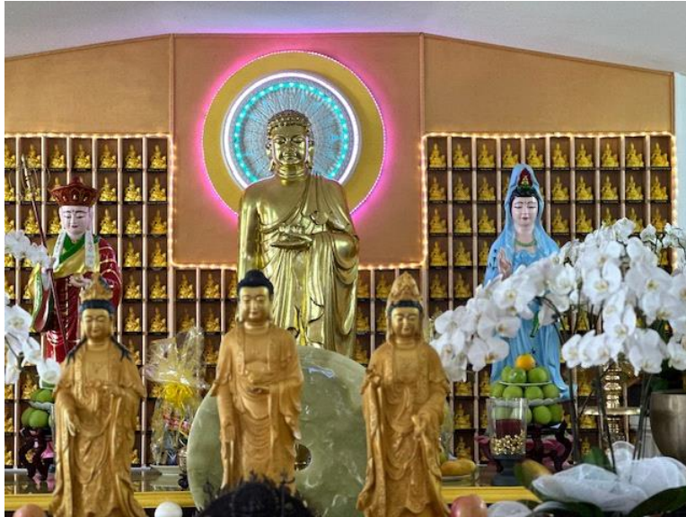
Chùa Bảo Sơn, 24613 5th Street, Murrieta, CA 92562

Thầy Tuệ Sỹ đánh đàn dương cầm rất xuất sắc và bấm độn, xem tử vi tướng số tuyệt vời.