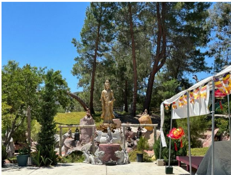
Chùa Bảo Sơn, 24613 5th Street, Murrieta, CA 92562

Ngày xưa, ở Việt Nam, chùa nào cũng mở cửa suốt ngày, suốt đêm cho Phật tử đến lạy Phật, cầu nguyện, nhưng ngày nay ở hải ngoại, chùa mở cửa có giờ. Buổi chiều, chùa nào cũng đóng cửa sớm, mùa Đông đóng cửa sớm hơn vì vấn đề an ninh, dù các chùa đều có hệ thống an ninh như chuông báo động, máy thu hình. Đa số nhà bên cạnh các ngôi chùa đều có hệ thống thu hình, thế nhưng vẫn có những người xấu tìm đến chùa để bưng thùng phước sương, thật ra thì những thùng này không có bao nhiêu tiền.