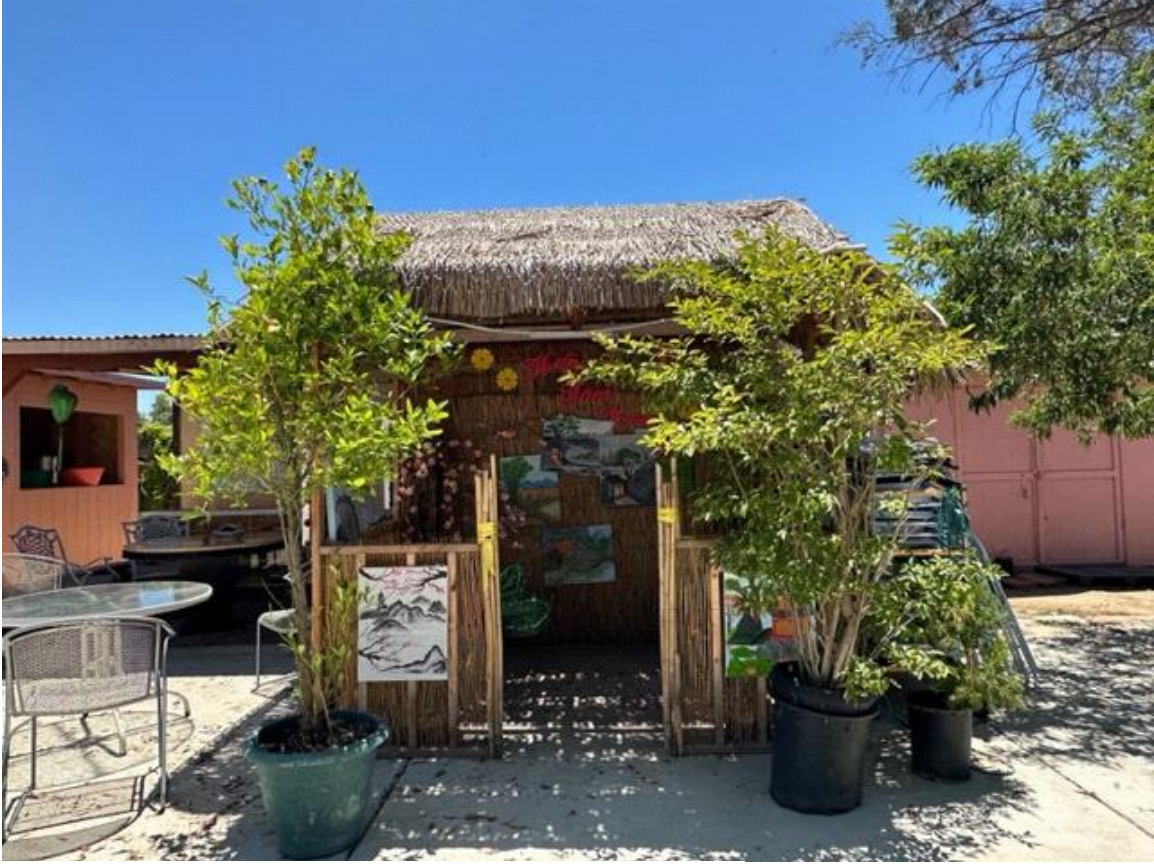
Chùa Bảo Sơn, 24613 5th Street, Murrieta, CA 92562

Xin mời đồng hương đến thăm các chùa xa thành phố như các chùa ở San Bernardino, Riverside, Imperial County. Người tu ở những nơi này ít nói, nhưng chú trọng đến kinh sách, ấn tống kinh sách, tụng kinh mỗi đêm. Đêm đêm, nơi xa vang vang tiếng kinh, tiếng mõ nơi thanh tịnh, hòa hợp với tiếng chim, tiếng suối reo, mọi người sẽ thấy đời sống thanh bình, hạnh phúc.