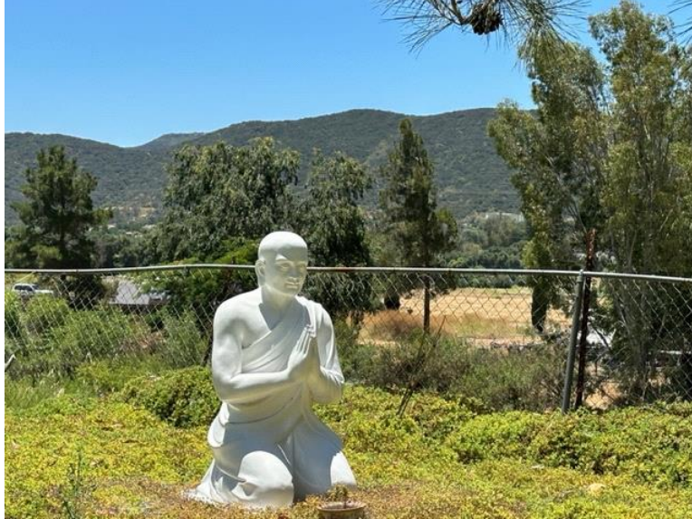
Chùa Bảo Sơn, 24613 5th Street, Murrieta, CA 92562

Ngày xưa, ở Việt Nam, chùa nào cũng mở cửa suốt ngày, suốt đêm cho Phật tử đến lạy Phật, cầu nguyện, nhưng ngày nay ở hải ngoại, chùa mở cửa có giờ. Buổi chiều, chùa nào cũng đóng cửa sớm, mùa Đông đóng cửa sớm hơn vì vấn đề an ninh, dù các chùa đều có hệ thống an ninh như chuông báo động, máy thu hình. Đa số nhà bên cạnh các ngôi chùa đều có hệ thống thu hình, thế nhưng vẫn có những người xấu tìm đến chùa để bưng thùng phước sương, thật ra thì những thùng này không có bao nhiêu tiền.