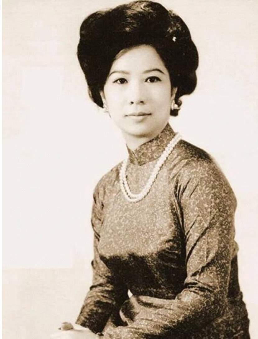
Phu nhân Tổng Thống Việt Nam Cộng Hòa Nguyễn Văn Thiệu. Bà Christine Nguyễn Thị Mai Anh

Mơ ước của tôi nhỏ bé lắm, mơ ước mỗi tuần đừng nghe tin một người quen nào của mình vĩnh viễn ra đi, nhưng lớn tuổi lại làm nghề truyền thông làm sao khỏi nghe một người quen ra đi hàng tuần. Tuần này, một phụ nữ với nụ cười rất hiền vừa ra đi.