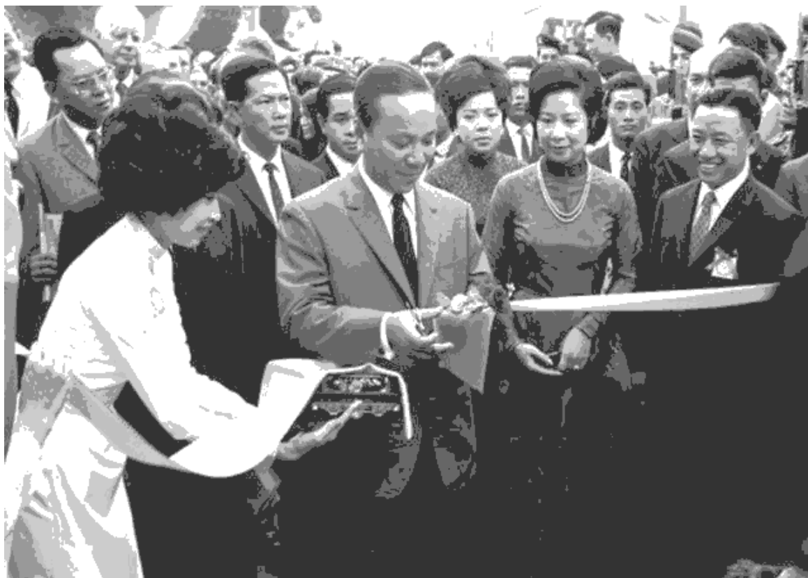
Cố Tổng Thống Việt Nam Cộng Hòa Nguyễn Văn Thiệu và phu nhân Christine Nguyễn Thị Mai Anh